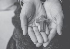
ការសង្កេត និងប្រវត្តិ សាស្ត្រនឹងជួយយើងឱ្យ មើលឃើញលទ្ធផលនៃ ទំនាក់ទំនង រវាងព្រះជា ម្ចាស់ និងមនុស្ស។

ជាមានមែនឬអត់ ដោយមិនបាច់គិតច្រើន។ បទពិសោធន៍អាចជួយឱ្យយើង ស្គាល់ព្រះវត្តមានរបស់ព្រះ។ ការសង្កេត និងប្រវត្តិសាស្ត្រនឹងជួយយើងឱ្យមើល ឃើញលទ្ធផលនៃទំនាក់ទំនង រវាងព្រះជាម្ចាស់ និងមនុស្ស។ ហើយការបើក បង្ហាញនឹងជួយឱ្យយើងស្គាល់ព្រះ។