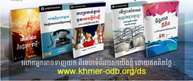
លោកអ្នកអាចទាញយក ពីគេហទំព័ររបស់យើងខ្ញុំ ដោយឥតគិតថ្លៃ : www.khmer-odb.org/ds

លោកអ្នកអាចមានការយល់ដឹង និងស្រឡាញ់ព្រះបន្ទូលព្រះកាន់តែស៊ីជម្រៅ ដោយប្រើសៀវភៅការរុករកឃើញរបស់យើងខ្ញុំ។ សូមស្វែងយល់បន្ថែមអំពីព្រះ ព្រះគម្ពីរ ជំនឿគ្រីស្ទបរិស័ទ និងការអនុវត្តន៍ និងប្រធានបទជាច្រើនទៀត ក្នុងអត្ថ បទដ៏មានន័យ ដែលផ្តល់ឲ្យនូវការបង្រៀនព្រះគម្ពីរ និងយោបល់ដ៏មានប្រសិទ្ធ ភាព អំពីការរស់នៅជាគ្រីស្ទបរិស័ទ។ អ្នកក៏អាចស្វែងរកសៀវភៅទាំងនេះបាន ក្នុងវេបសាយ : www.khmer-odb.org/ds/